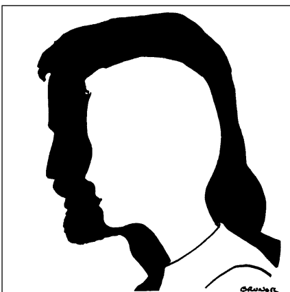
"Et moi, je suis avec vous tous les jours jusqu'à la fin du monde".

des messagers de la bonne nouvelle de ton amour.